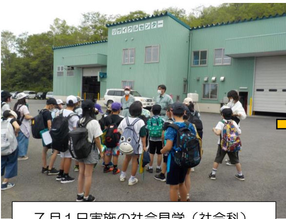
7月1日実施の社会見学(社会科)

4年生の国語の学習のようすです。 子どもたちは 社会科の社会見学で学んだことを 国語の学習でリーフレットに まとめていました。 複数の教科で共通のテーマをもって 学ぶ「教科横断的な学習」のひとつです。